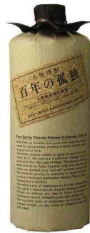
百年の孤独(麦) ¥30,000 (¥33,000)