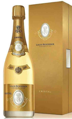
Louis Roederer CRISTAL MAGNUM 1500ml ルイ ロデレール クリスタル マグナム ¥600,000 (¥660,000)