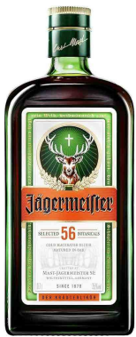
Jagermeister イエガーマイスター ¥30,000 (¥33,000)