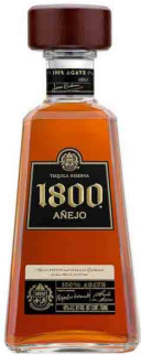
1800 Anejo 1800 アネホ ¥45,000 (¥49,500)