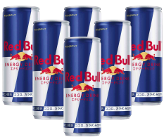
Red Bull SET 6 piece レッドブルセット

¥3,000 ※ボトルオーダーのみ (¥3,300) ※Bottle orders only