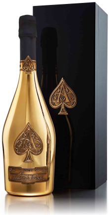
ARMAND de BRIGNAC BRUT JEROBOAM 3000ml アルマンド ブリニャック ジェロボアム ¥1,200,000 (¥1,320,000)