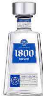
1800 Silver 1800 シルバー ¥30,000 (¥33,000)