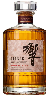
Hibiki Blender's Choice (Japanese) 響 ブレンダーチョイス(日本)