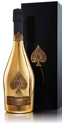
ARMAND de BRIGNAC BRUT MAGNUM 1500ml アルマンド ブリニャック マグナム ¥350,000 (¥385,000)