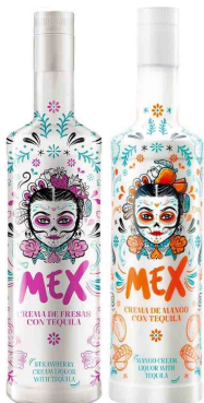
MEX (Strawberry-Mango) メックス (ストロベリー・マンゴー) ¥30,000 (¥33,000)

※表示価格は全て税込みとなります。 別途、サービス料18%が追加となります。 Price with consumption tax included(10%) 18% Service charge is an additional.