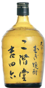
吉四六瓶(麦) ¥30,000 (¥33,000)