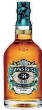
CHIVAS REGAL MIZUNARA 18 Year (Scotch) シーバスリーガルミズナラ 18年(スコッチ)