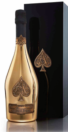
ARMAND de BRIGNAC BRUT MAGNUM 1500ml アルマンド ブリニャック マグナム ¥350,000 (¥385,000)