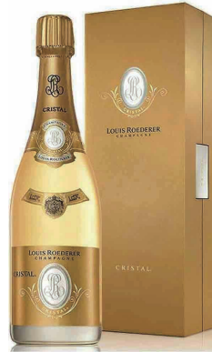
Louis Roederer CRISTAL MAGNUM 1500ml ルイ ロデール クリスタル マグナム ¥600,000 (¥660,000)