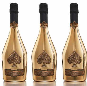
ARMAND 3本SET アルマンド