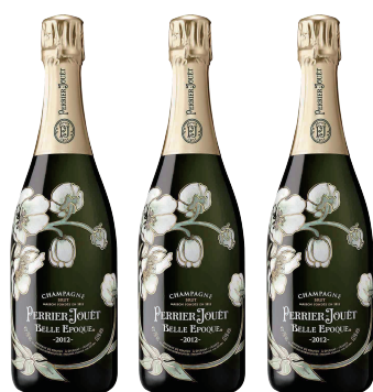
Belle Epoque 3本SET ベル エポック