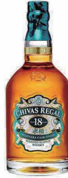
CHIVAS REGAL MIZUNARA 18 Year (Scotch) シーバスリーガルミズナラ 18年(スコッチ)