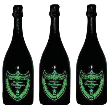
Dom Perignon 3本SET ドン・ペリニョン