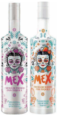
MEX (Strawberry·Mango) メックス (ストロベリー・マンゴー)