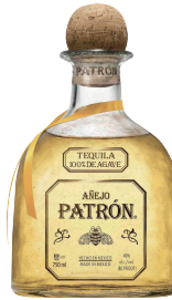
PATRÓN AÑEJO パトロン アネホ