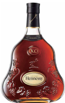
HENNESSY X.O ヘネシーX.O