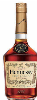
HENNESSY V.S ヘネシーV.S