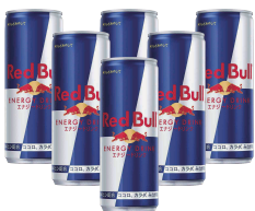
Red Bull SET 6 piece レッドブルセット

¥3,000 ※ボトルオーダーのみ (¥3,300) ※Bottle orders only