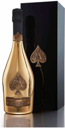
ARMAND de BRIGNAC BRUT JEROBOAM 3000ml アルマンド ブリニャック ジェロボアム ¥1,200,000 (¥1,320,000)