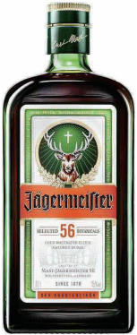
Jagermeister イエガーマイスター