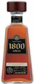
1800 Añejo 1800 アネホ