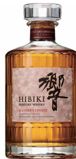
Hibiki Blender's Choice (Japanese) 響 ブレンダーチョイス(日本)